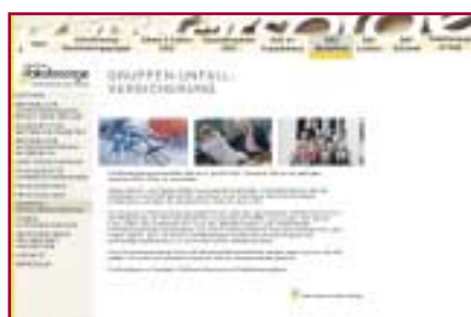
terminalpräsentation – bav-broschüre

für den öffentlichen einsatz wurde das system mit einem passwort geschützt, so dass sich der user nur innerhalb der präsentation bewegen kann, jedoch keinen zugriff auf den restlichen computer hat.