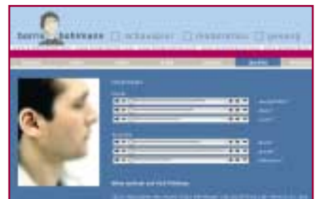
kreativkind – audioseite

dann haben wir uns an die umsetzung in den programmen photoshop, dreamweaver, cleaner und quicktime pro gemacht. auf der website kann man