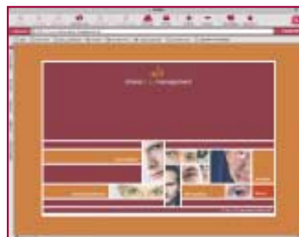
odm-website – startseite

management hat georgetown media bei der gelegenheit natürlich auch gleich gemacht!