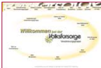
terminalpräsentation – startseite

nehmen“, „geschäftsbereiche 2002“ und „betriebliche altersvorsorge“. je nach standort des terminals kann auch direkt auf den internet-auftritt der volksfürsorge zugegriffen werden. der