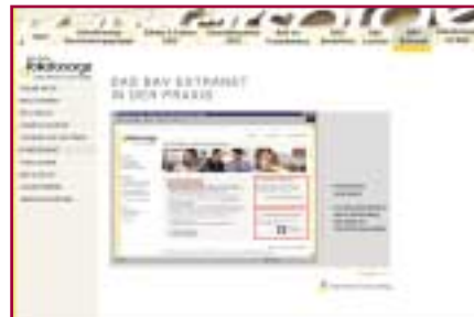
terminalpräsentation – extranet

inhaltlich umfasst die präsentation unter anderem die bereiche „das unter-